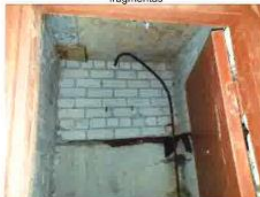
Boilerinė 1H1p (u.n. 8199-2010-1014), sklypo fragmentas