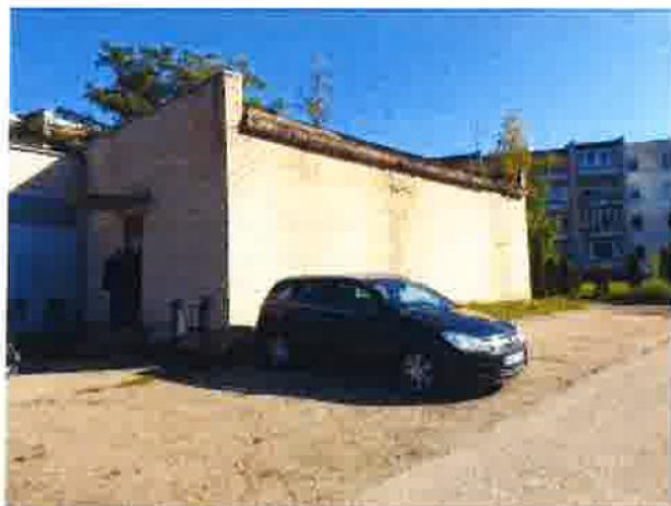
Boilerinė 1H1p (u.n. 8199-2010-1014), sklypo fragmentas