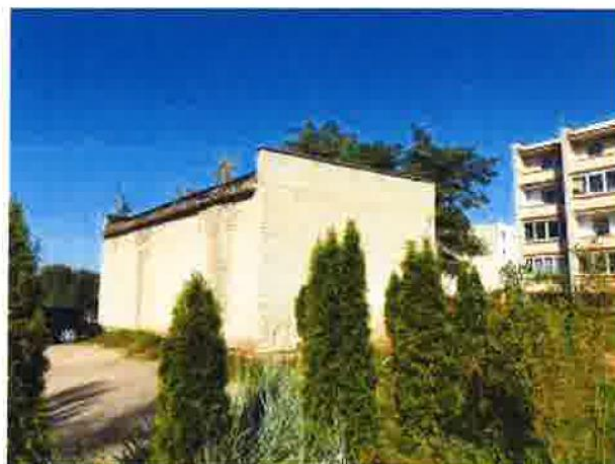
Boilerinė 1H1p (u.n. 8199-2010-1014), sklypo fragmentas