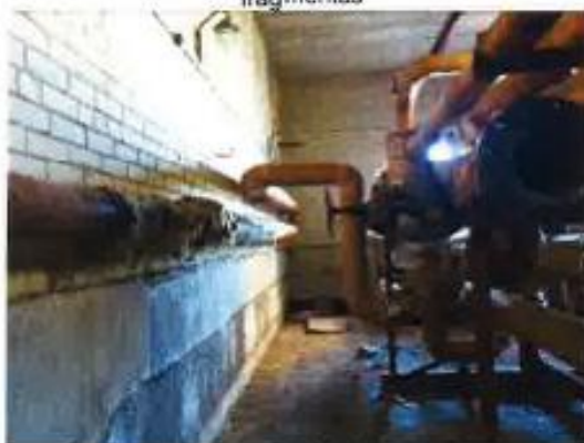
Boilerinė 1H1p (u.n. 8199-2010-1014), sklypo fragmentas