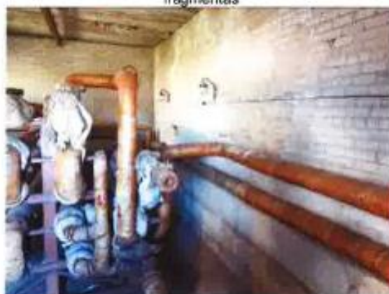
Boilerinė 1H1p (u.n. 8199-2010-1014), sklypo fragmentas