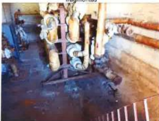
Boilerinė 1H1p (u.n. 8199-2010-1014), sklypo fragmentas