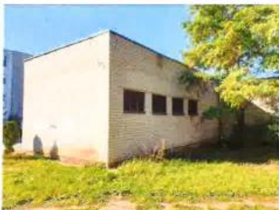
Boilerinė 1H1p (u.n. 8199-2010-1014), sklypo fragmentas