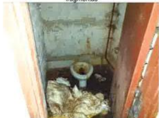
Boilerinė 1H1p (u.n. 8199-2010-1014), sklypo fragmentas