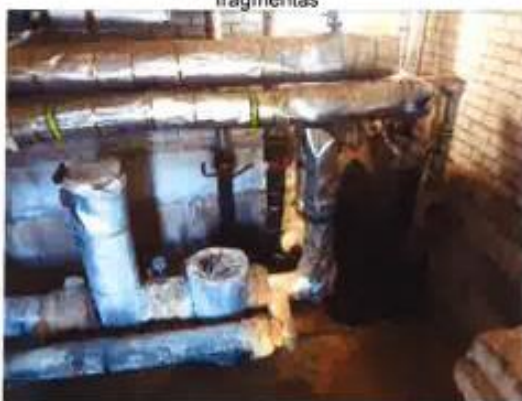
Boilerinės 1H1p (u.n. 8199-0007-3011) vidaus fragmentas