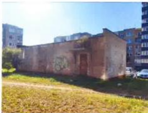
Boilerinė 1H1p (u.n. 8199-0007-3011), sklypo fragmentas