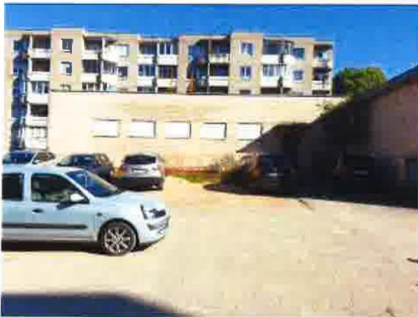
Boilerinė 1H1p (u.n. 8199-0007-3011), sklypo fragmentas