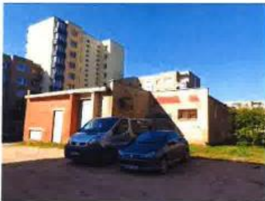
Boilerinė 1H1p (u.n. 8199-0007-3011), sklypo fragmentas