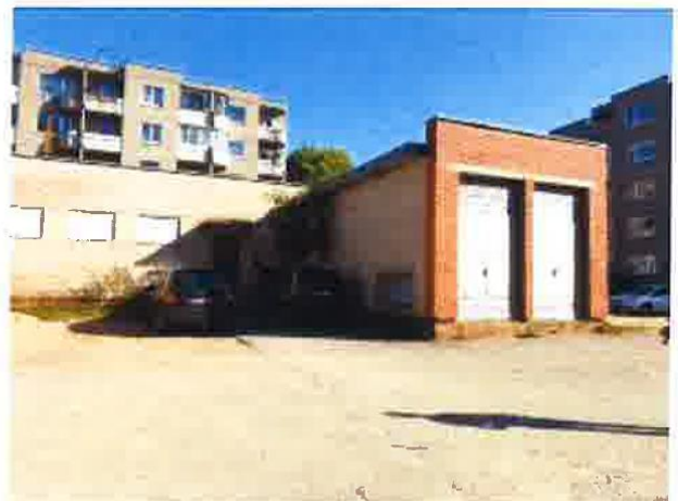
Boilerinė 1H1p (u.n. 8199-0007-3011), sklypo fragmentas