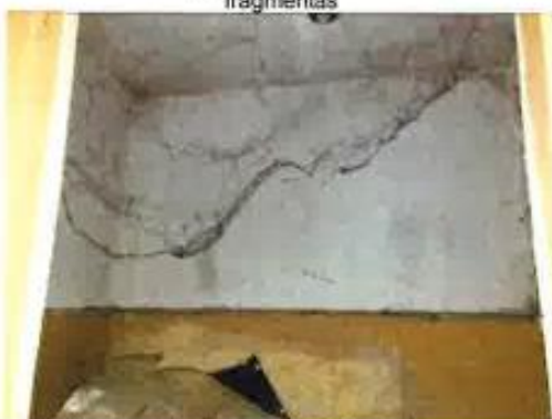
Boilerinės 1H1p (u.n. 8199-0007-3011) vidaus fragmentas