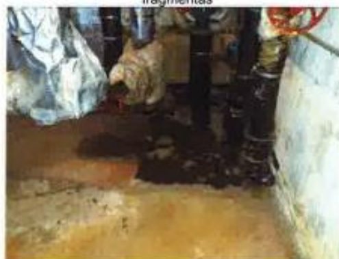
Boilerinės 1H1p (u.n. 8199-0007-3011) vidaus fragmentas