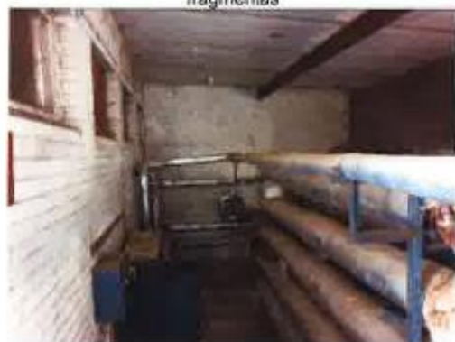
Boilerinės 1H1p (u.n. 8199-0007-3011) vidaus fragmentas